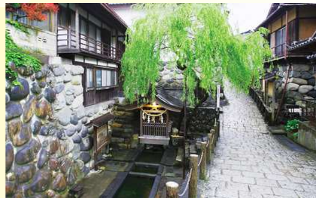
名水百選第1号「宗祇水(そうぎすい)」

郡上八幡城は、日本最古の木造再建城です。戦国時代末期の永禄2年(1559年)に遠藤盛数によって砦が築かれ、現在の城郭一帯の石垣はすべて県の史跡に指定されています。昭和8年(1933年)に木造の模擬天守が再建され、80年以上経った現在も、郡上の歴史を伝えています。美しい山城としても知られ、積翠城とも呼ばれています。